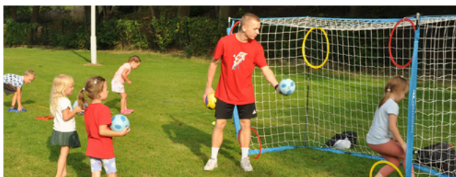
Gry i zabawy dla dzieci

Lato w gminie Bestwina nie kończy się wraz z tą konkretną imprezą. Wrzesień to również wielkie emocje na świeżym powietrzu – Dożynki Gminne, kajak-polo, piłka nożna i wiele innych wydarzeń organizowanych w sołectwach.