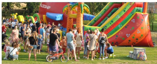
Impreza cieszyła się dużą frekwencją