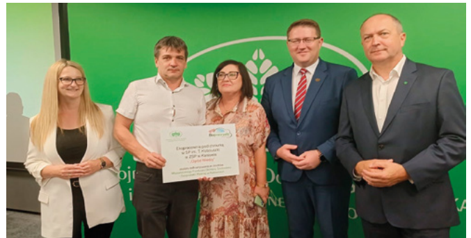
Delegacja z Bestwiny na gali w Chorzowie

aktywizację i edukację przyrodniczą. Całkowita wartość projektu Ekopracownia pod chmurką w SP im. Tadeusza Kościuszki w Kaniowie – Ogród Wiedzy to 85 291,32 zł., wartość dofinansowania: 67 124,62 zł., realizacja potrwa w okresie od 01.09.2024 r. do 21.06.2025 r. Projekt współfinansowany w formie dotacji przez Wojewódzki Fundusz Ochrony Środowiska i Gospodarki Wodnej w Katowicach.