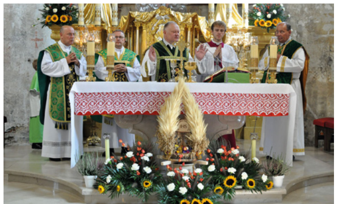
Msza św. dziękczynna za plony