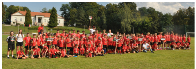
Drużyny LKS Bestwina