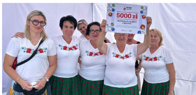
Gospodynie z Bestwiny znów z pierwszą nagrodą

Wystawa zorganizowana przez Śląski Ośrodek Doradztwa Rolniczego w Częstochowie historycznie nawiązuje do wielkiej