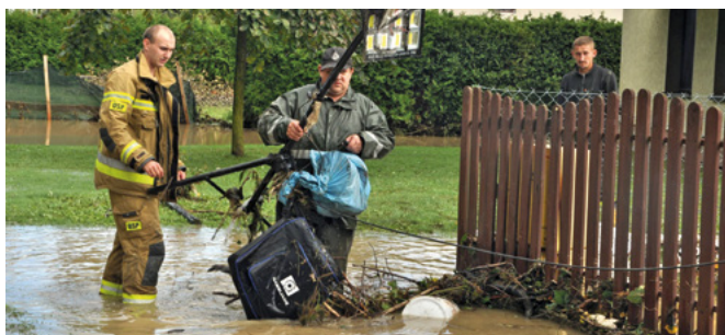
Strażacy usuwają skutki kataklizmu

W Urzędzie Gminy Bestwina uruchomiono dyżur sztabu kryzysowego działającego całodobowo w okresie największego zagrożenia opadami, natomiast pod numerem telefonu (0-32) 215-77-00 mieszkańcy mogą na bieżąco zgłaszać powstałe