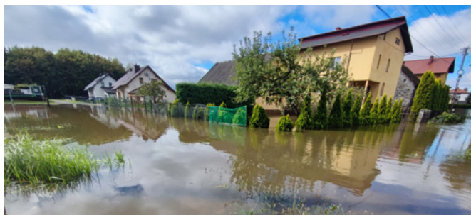
Kaniów – ul. Dankowicka

Nie tylko prywatne posesje zostały zniszczone przez wielką wodę: Boisko LKS Bestwina, KS Bestwinka lub strażnica OSP Bestwina z odnowionymi niedawno salkami i inne budynki użyteczności publicznej