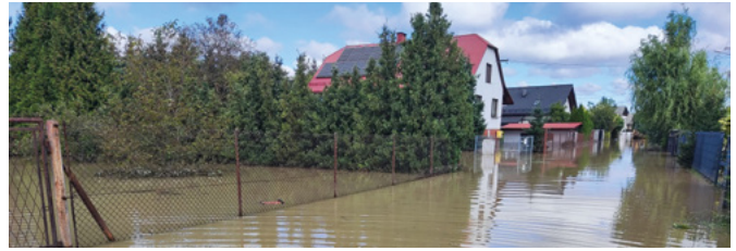
ul. Pastwiskowa w Bestwinie

Osoby poszkodowane, jeśli znalazły się w szczególnie trudnej sytuacji życiowej, w której nie mogą zaspokoić niezbędnych potrzeb bytowych w oparciu o posiadane środki własne, mogą zgłaszać się do pracowników Gminnego Ośrodka Pomocy Społecznej przy ul. Szkolnej 4 lub pod numerem telefonu 32 215 46 37 (w godzinach pracy GOPS).