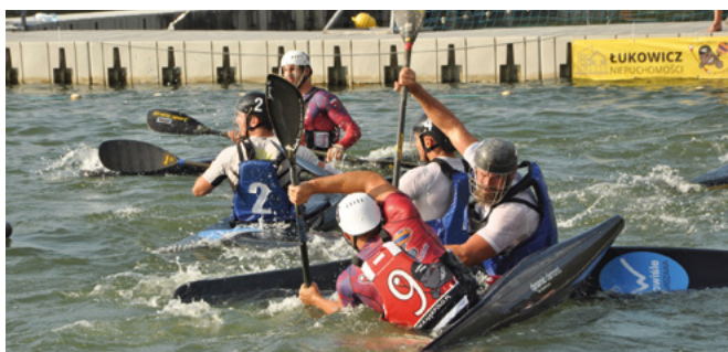
Final w kategorii seniorów

Zawody w Kaniowie odbywały się w dniach 7–8 września. Jak zawsze obejrzelśmy porywające widowisko sportowe, były także chwile wzruszenia towarzyszące podsumowaniu imprezy. Rozegrano 96 spotkań z udziałem 39 drużyn i 10 klubów z całego kraju. Powodów do radości dostarczyli reprezentanci UKS Set Kaniów: Seniorki zdobyły tytuł mistrzyni Polski po raz 11 z rzędu, seniorzy wywalczyli srebrne