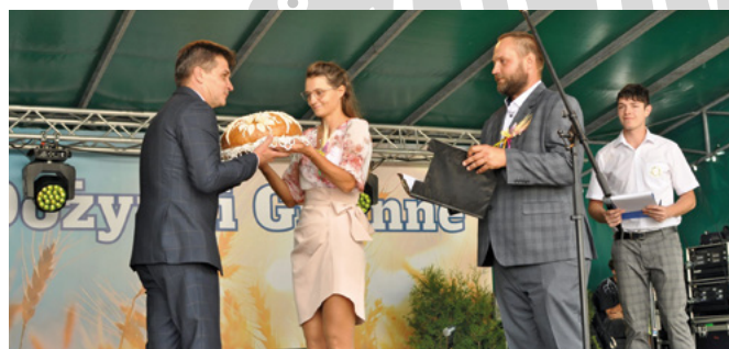
Uroczyste przekazanie chleba