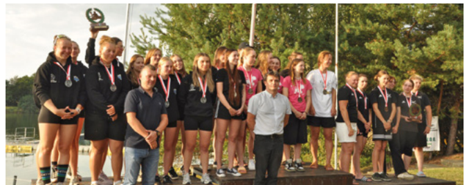
Seniorki UKS Set Kaniów na najwyższym stopniu podium

Uczestnikom i organizatorom serdecznie gratulujemy!