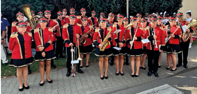
Orkiestra na ulicach Tarnowskich Gór

Po bardzo udanym i pełnym wrażeń występie we Francji, Orkiestra Dęta Gminy Bestwina z siedzibą w Kaniowie podbiła Tarnowskie Góry. Już od lat nasi muzycy współpracują z Tarnogórką Orkiestrą Dętą, czego efektem były m.in. występy tej formacji na Rewiach Orkiestr Dętych, organizowanych dawniej w Kaniowie.